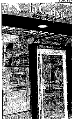
Oficina de La Caixa

Esta emisión, cuyo desembolso se hará efectivo el próximo 9 de